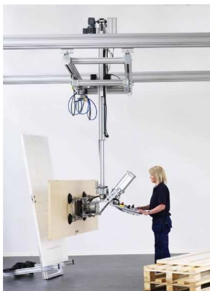
Hantering av dörrar eller annat skivmaterial.