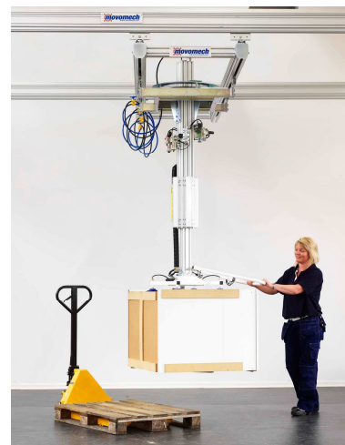
Hantering av större skåp mm.

Vanliga tillämpningsområden för Mechlift är lyft- och hantering av rullar, plåtar, dörrar, fönster, tankar samt allehanda fordonsdetaljer.